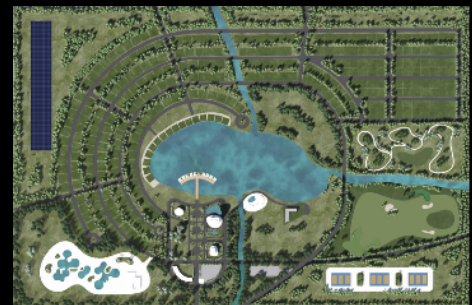
Karte von unserer Bee House World

Unsere virtuelle Welt kennt nahezu keine Grenzen. Die Funktionalität sowie der Nutzen gehen weit über den Hausbau hinaus: In der Bee House World können sich Kundinnen und Kunden frei bewegen, was ein optimales Umfeld für Werbung und Inspiration bietet. Zudem sind in der Bee House World, bis zu 150 Architekten auf Grundstücken mit einem ihrer Häuser vertreten, welche sie zu Werbezwecken präsentieren können.